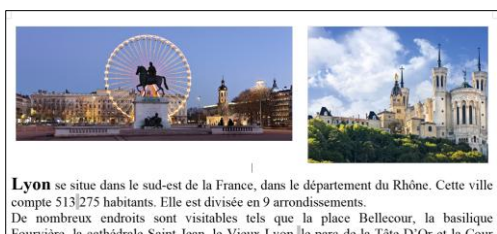
Notice sur Lyon